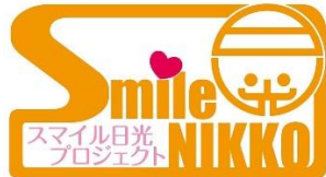
スマイル日光プロジェクトロゴマーク

当プロジェクトの趣旨にご賛同いただき、社会貢献を推進する日光市内の企業であれば、どなたでも参加できます。現在（2016年3月現在）は、16社でプロジェクトを遂行しています。なお、参加企業および寄付つき商品は以下のマークが目印となります。