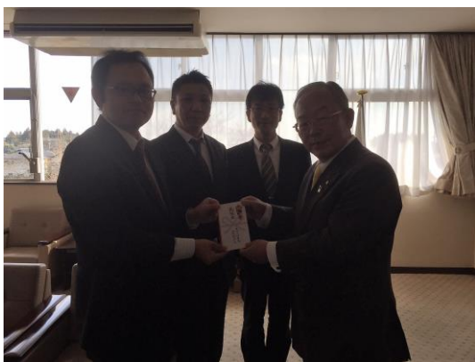
日光市長へ (関東・東北豪雨災害義援金)